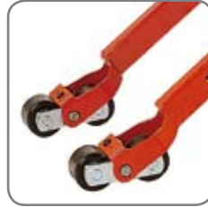
Telipyörillä on jarrutoiminto. Pyörämateriaalit ovat lattiaystävällisiä.