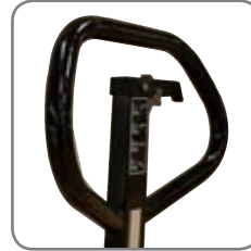
Ergonominen kahva takaa käyttäjälle rennon otteen.