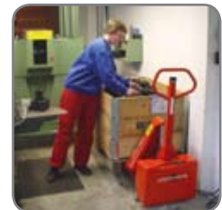
Patentoitu sylinterirakenne mahdollistaa matalan rakennekorkeuden.