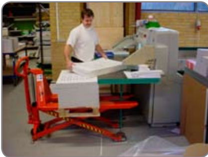
Pieni voiman tarve ja käyttökahvan vapaa-asento ovat HL1005:lle ominaisia.