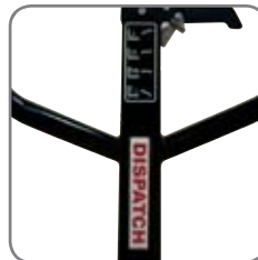
Mahdollisuus merkitä vaunu nimellä/ osastolla.