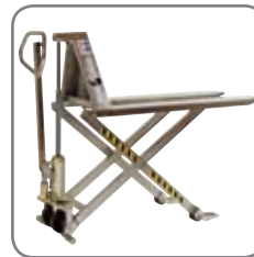
Saatavissa käsi- tai akkukäyttöisenä, ruostumattomana taikka Ex-suojattuna.