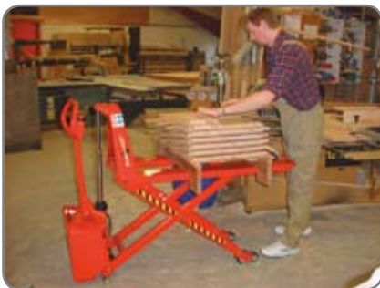
Lisävarusteina: kauko-ohjaus, automaattinen tasonsäätö, jarru, erillinen taikka sisäänrakennettu laturi.