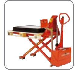
Automaattinen korkeuden-säätölaitte (lisävaruste) varmistaa ihanteellisen työskentelykorkeuden.