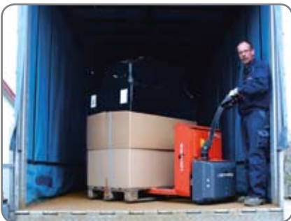
Panther Maxi (kapasiteetti 1800 kg) suositellaan raskaampaan lavankäsittelyyn, esim. kuljetusalalla.