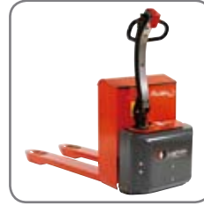
Vankka rakenne takaa pitkän käyttöiän ja alhaiset ylläpitokustannukset.