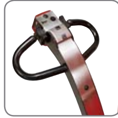
Voidaan käyttää kahva pystyasennossa. Kaikki ohjauspainikkeet on sijoitettu käyttökahvaan.