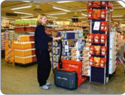
Panther Mini (kapasiteetti 1400 kg) suositellaan kevyempään lavankäsittelyyn, esim. kaupoissa ja varastoissa.