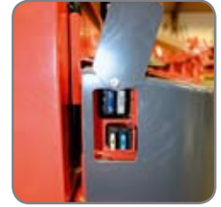
Osat ja rakenteet helposti käsillä – helpottaa ja nopeuttaa vaunun huoltamista.