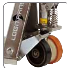
Runsaasti eri pyörävaihtoehtoja.