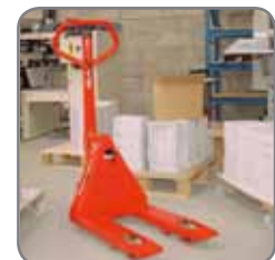
Pantherin saa eri haarukkapituuksilla.