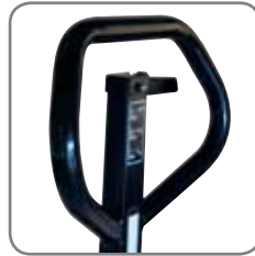
Ergonominen kahva takaa käyttäjälle rennon otteen. Mahdollista merkitä vaunu nimellä/ osastolla.