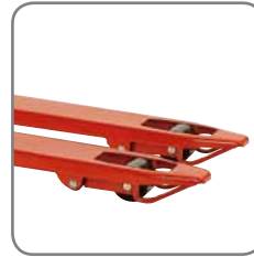
Haarukoiden päässä olevat ohjauksiskot helpottavat vaunun työntämistä "suljettujen" lavojen alle.