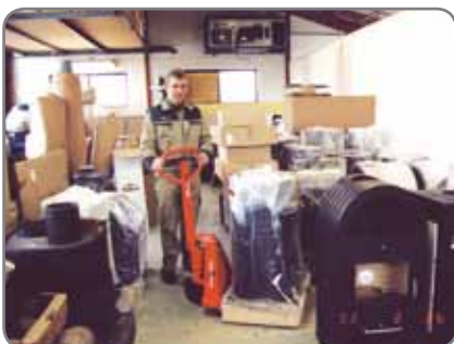
Lavojen vaivaton käsittely myös erittäin ahtaissa tiloissa.