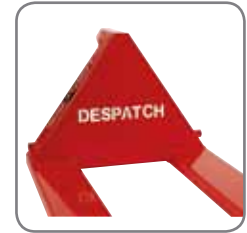
Yrityksen nimi tai logo voidaan polttoaivertaa haarukkavaunun kolmioon.