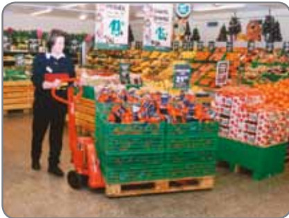
Säädettävä haarukkakorkeus - matalat ja kuluneet lavat eivät aiheuta ongelmia.

Mallistossa myös ruostumattomasta teräksestä valmistetut, sekä ex-suojatut haarukkavaunut.