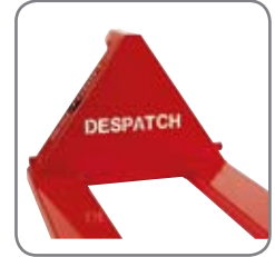
Yrityksen nimi tai logo voidaan polttoaivertaa haarukkavaunun kolmioon.