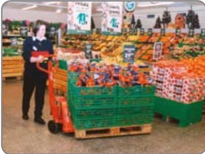
Säädettävä haarukkakorkeus - matalat ja kuluneet lavat eivät aiheuta ongelmia.

Mallistossa myös ruostumattomasta teräksestä valmistetut, sekä ex-suojatut haarukkavaunut.