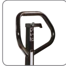
Ergonominen kahva takaa käyttäjälle rennon otteen. Mahdollista merkitä vaunu nimellä/ osastolla.