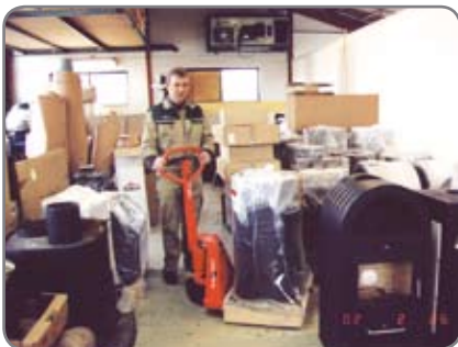
Lavojen vaivaton käsittely myös erittäin ahtaissa tiloissa.