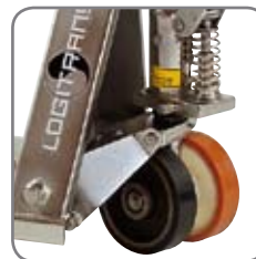
Runsaasti eri pyörävaihtoehtoja.