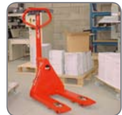
Pantherin saa eri haarukkapituuksilla.