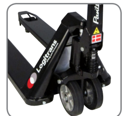
Panther Silentissa on pikanosto vakiona.