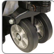
Erikoiskumiset pyörät ovat hellävaraiset lattioille ja laattapinnoille.