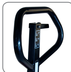
Ergonominen kahva takaa käyttäjälle rennon otteen.