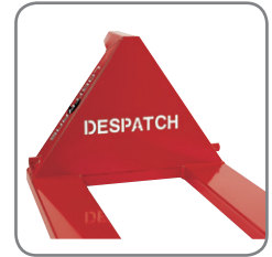
Nimi, logo tai muu teksti voidaan polttoakaivertaa päätykolmioon taikka vaunu voidaan toimittaa erityisen värisenä.