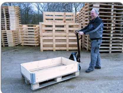
Panther Silentia voit käyttää myös ulkona. Metallilastut, pikkukivet lumi jne. eivät tartu pyöriin.