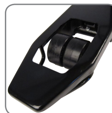
Rinnakkain asennetut haarukkapyörät takaavat hyvät kääntöominaisuudet.