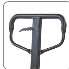
Kumipäällysteinen kahva takaa mukavan otteen.