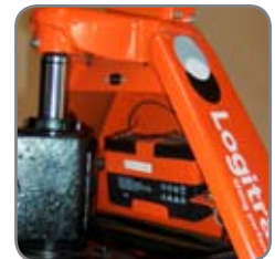
Sisäänrakennettu laturi helpokäyttöisellä pistokkeella.

Kysy lisätietoja tai vieraile kotisivullamme www.logitrans.com