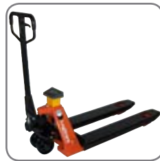
Tarkat punnitustulokset neljällä anturilla.