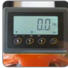
BFC6-vaakavaunussa on taaraus- ja nollustoiminnot. Punnitustulos kiloissa tai paunoissa.