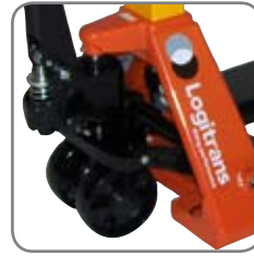
Vaunun kääntökulma on 210°, varmistaen helpon käytettävyyden ahtaissa paikoissa.