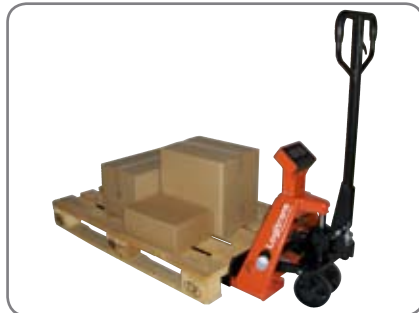
BFC6 - vaakavaunu kuljettaa ja punnitsee samalla kertaa.