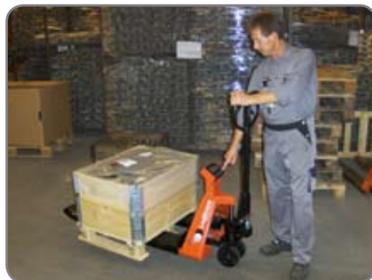
Ihanteellinen punnitus – vankka, tarkka ja käytettävissä missä tarvetta ilmeneekin.